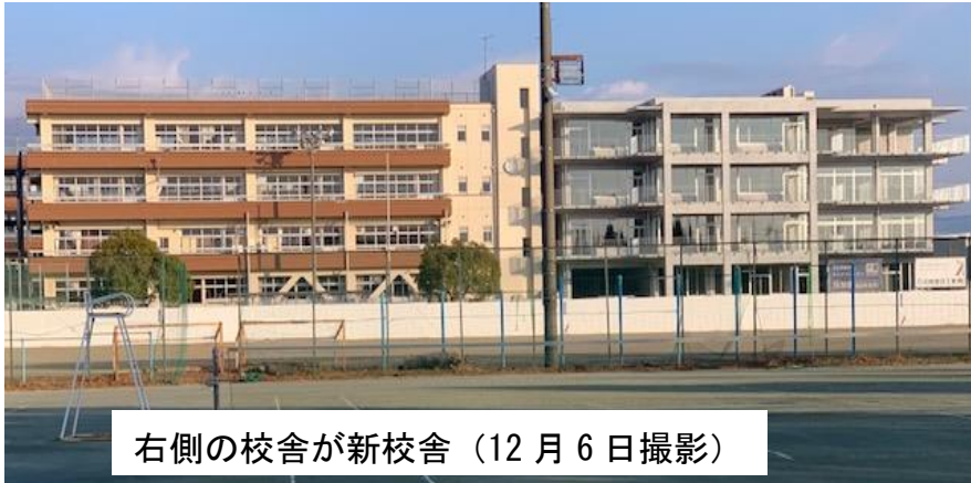
右側の校舎が新校舎（12月6日撮影）