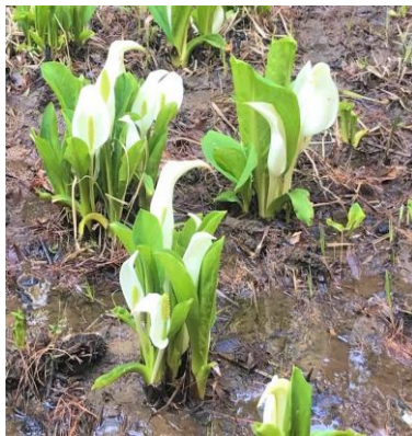
親水公園付近の水芭蕉は毎年3月下旬に咲き始めます

水芭蕉周辺遊歩道の危険箇所は再整備も視野に入れ、補修を行いたいと思います。ハイキングコースについては現地を確認し、利用者の安全確保のため修復作業を計画的に行ないたいと思います。金山には市内外から多くの人が訪れており、金山周辺整備とその予算付けは市民が納得するところだと考えますが、市長のお考えを伺います。