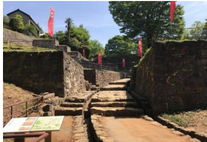
金山城跡大手虎口