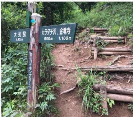
西山ハイキングコースの階段部分が崩壊(写真上)

金山は昔から市民に親しまれ、今は観光客にもその良さが認識されるようになりました。水芭蕉群生地も市民の力により育成されており、大変ありがたく思います。金山にお客さんがたくさん来ているため、ハイキングコースの整備は必要だと思います。しっかり予算を付けて整備することでさらにお客様が増え、本市の活力になりますので、喜ばれる丘陵として維持していきたいと思っております。