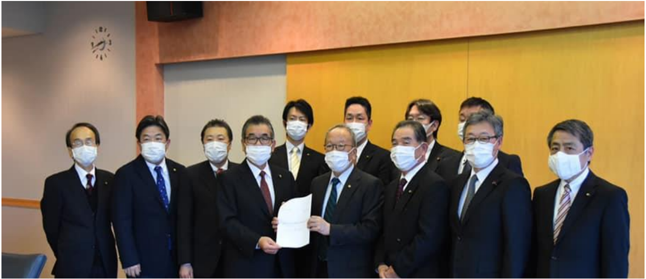
上毛新聞に掲載されました(4月15日朝刊)